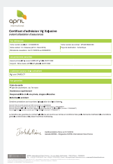
VOTRE CERTIFICAT D'ADHÉSION VALANT ATTESTATION D'ASSURANCE,