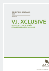
VOS CONDITIONS GÉNÉRALES DÉTAILLANT LE FONCTIONNEMENT DE VOTRE CONTRAT,